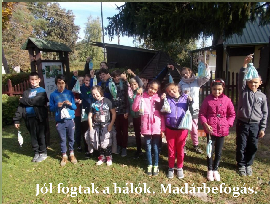
Jól fogtak a hálók. Madárbefogás.