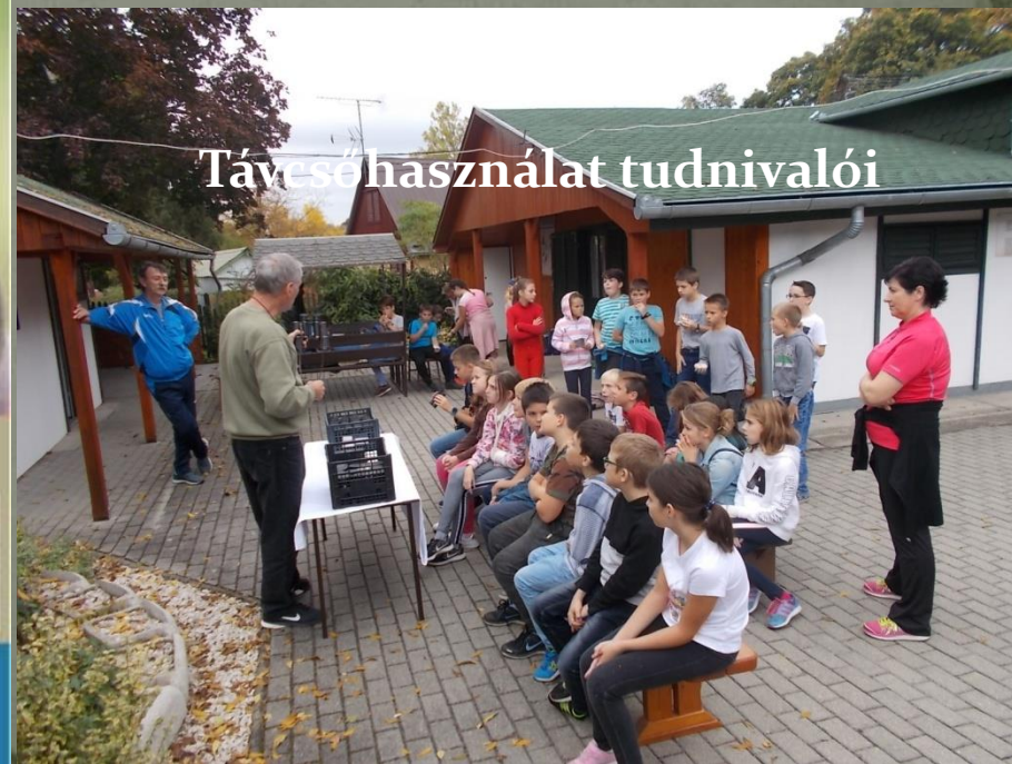
Távész használata tudnivalói